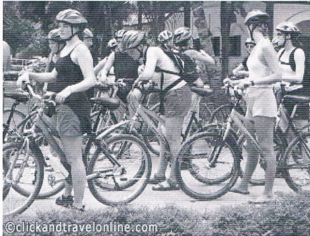
Groep vakantiegangers staan klaar om al fietsend Chiang Mai te verkennen

bedrijf, gevestigd in Chiang Mai. Het is geen grote reisorganisatie met Noord-Thailand als één van de vele bestemmingen, maar is een lokale onderneming die zich uitsluitend richt op het noorden van het land, met gespecialiseerde en gedegen kennis van de lokale omstandigheden. Wat zij bieden is gastheerschap voor het avontuurlijk deel van uw vakantie in Thailand. De filosofie achter de aanpak van Click and Travel Ltd. is gebaseerd op vele jaren praktijkervaring binnen de reiswereld van Thailand. Zij streven er naar op verantwoordelijke en toegewijde wijze toerisme te bedrijven. Zo bieden zij een alternatief voor de halfbakken, puur op winst gerichte houding, die in de reisindustrie zo vaak gewoon is. Hun manier van werken berust niet op het vergaren van commissies en is niet uitsluitend op geld gericht. Dat alleen al maakt hen anders! In tegenstelling tot vrijwel alle andere tour operators in dit deel van de wereld wensen zij geen extra inkomsten te vergaren door te pogen uw kooplust te stimuleren. Elk hotel, taxichauffeur of ander reisbureau zal graag behulpzaam zijn indien u een "commercieel toertje" wenst te maken. Die keuze dient u zelf te maken. Zij willen geen beslag leggen op uw gehele vakantie. Wel willen ze verantwoordelijk zijn voor een uniek en onvergetelijk deel daarvan. Waar het hen om gaat is u daar te brengen waar u anders niet zou komen en u dat te tonen wat u anders niet zou zien.