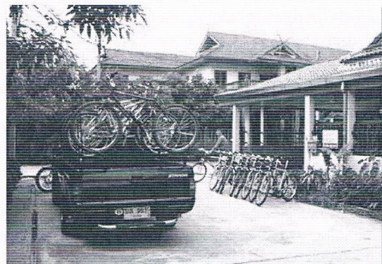
Het kantoor van Click en travel in Chiang Mai

Click and Travel Ltd. is een jong en fris