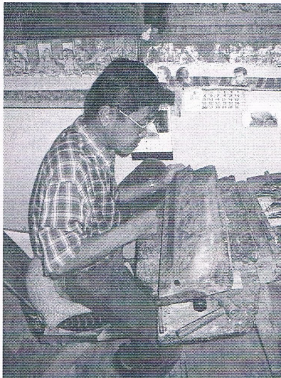
Houtbewerker in de Leprozenkolonie

Nu moesten we even een beetje verder fietsen naar het dorpje Ban Tawai, waar we ook onze lunch zouden gebruiken. Ban Tawai is een dorpje dat bijna uitsluitend bestaat uit inwoners