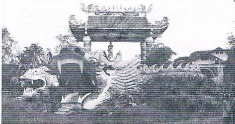
Chinese tempel even buiten Chiang Mai

nengegaan zagen we een tunnel met op de muren het levensverhaal van Boeddha geschilderd. Hier kregen we dan ook van Etienne de grote stappen in het leven van Boeddha uitgelegd en daarna heeft hij