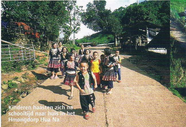
Kinderen haasten zich na schooltijd naar huis in het Hmongdorp Hua Na.