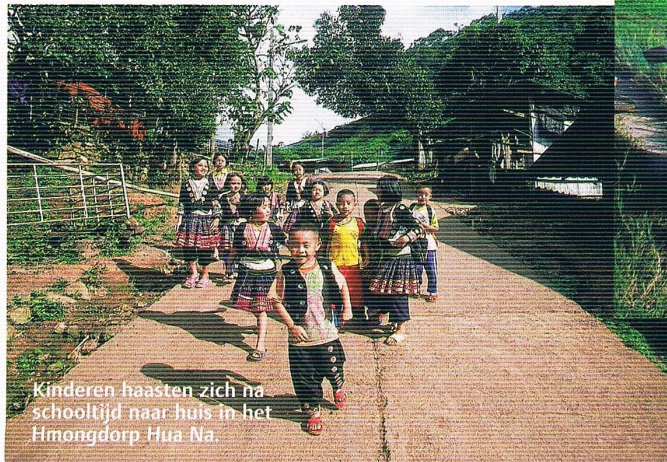
Kinderen haasten zich na schooltijd naar huis in het Hmongdorp Hua Na.